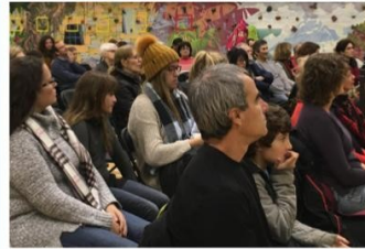
Spectateurs attentifs. Toutes les générations sont réunies !