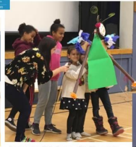
La mascotte "Papirecyone" créée par les enfants, biodégradable et sans colle